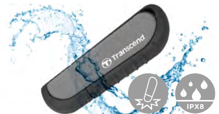
Resistente contra agua y los golpes