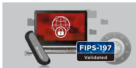
Validación FIPS 197

El JetFlash Vault 100 de Transcend es un dispositivo USB flash cifrado que ofrece protección criptográfica con encriptación de hardware AES de 256 bits en modo XTS. Utilizando el interfaz SuperSpeed USB 3.1 de la Gen 1, el JetFlash Vault 100 permite la transferencia de todos sus archivos y carpetas confidenciales en velocidades de transferencia increíblemente rápidas.