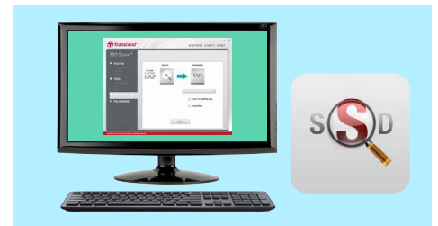
SSD Scope 軟體，系統複製