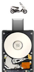
Disco Duro Pórtatil